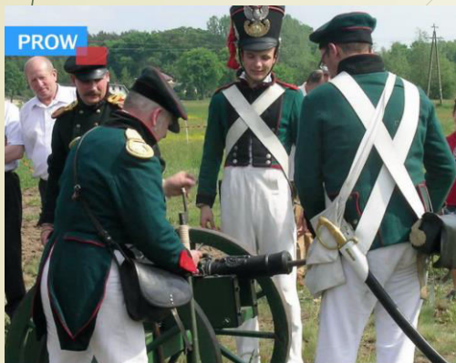
Organizacja inscenizacji zwycięskiej bitwy pod Stoczkiem Łukowskim