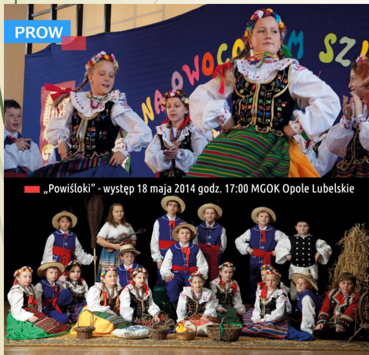
Fot. Projekty zrealizowane w ramach naborów LGD Owocowy Szlak