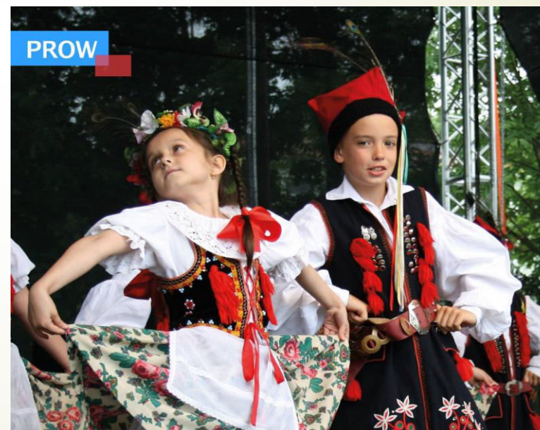
■ Festiwal Flaków - elementem budowania i promocji marki turystycznej i gospodarczej LGD „Dolina Gietzwi”.