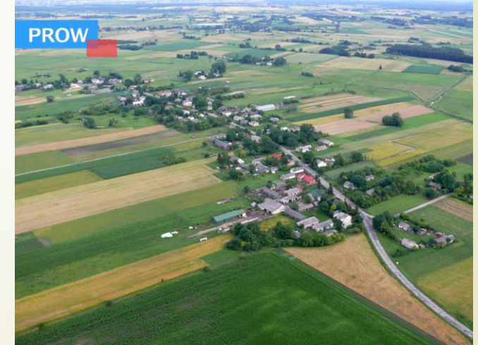
■ Budowa Centrum Aktywizacji Fizycznej i Kulturalnej w Kozubszczyźnie