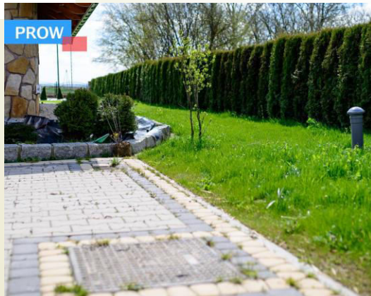
■ Budowa przydomowych oczyszczalni ścieków w miejscowościach: Radawiec Mały, Zemborzyce Tereszyńskie, Zemborzyce Wojciechowskie i Pawlin