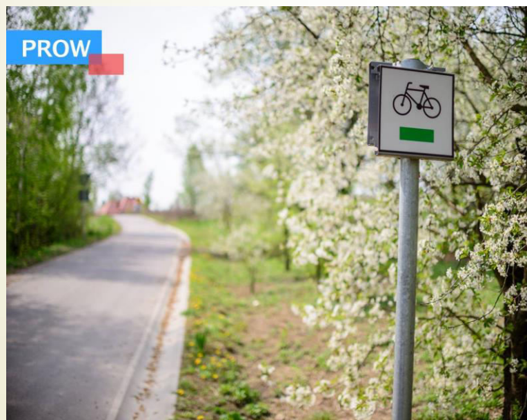
■ Zielony szlak rowerowy po Gminie Niemce