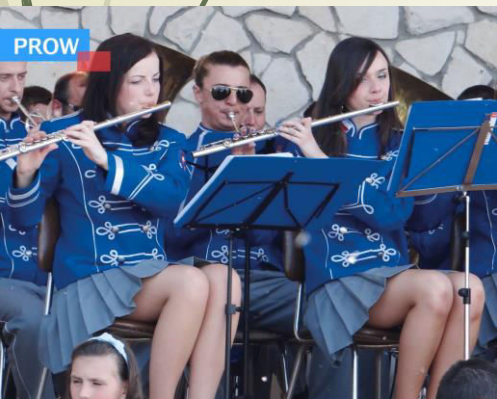
Wyposażenie Gminnej Orkiestry Dętej z Gminy Melgiew