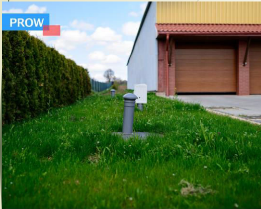
■ Budowa przydomowych oczyszczalni ścieków w miejscowościach: Radawiec Mały, Zemborzyce Tereszyńskie, Zemborzyce Wojciechowskie i Pawlin